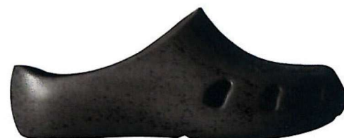
NERO | N° 35/48