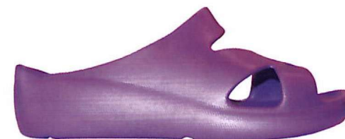
LILLA | N° 35/41