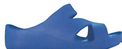
AZZURRO | N° 24/34

NUMERI DISPONIBILI: 24 - 26 - 28 - 30 - 32 - 34