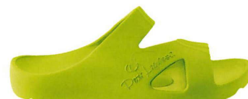
VERDE ACIDO | N° 40/46